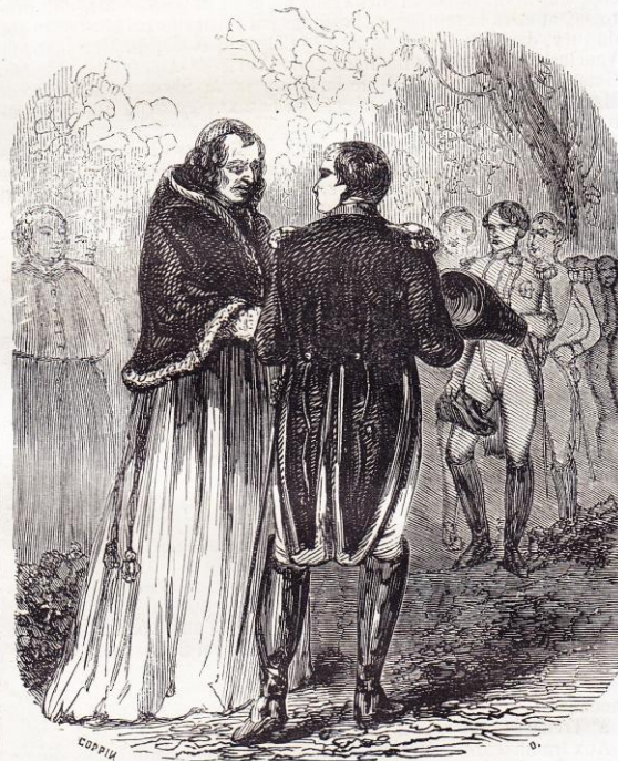
Napoléon et le pape dans la forêt de Fontainebleau Page 406.

Un immense amphithéâtre était occupé par sept cents invalides et