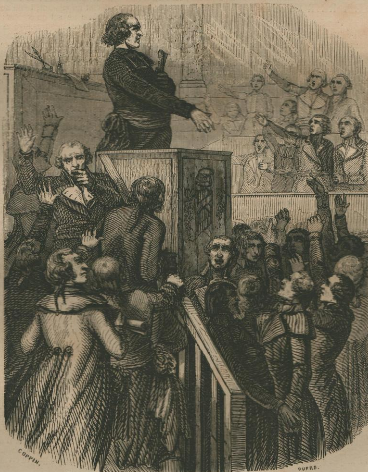
Proclamation de la République. Page 4.

Nos soixante dernières années composent en quelque sorte six grands siècles historiques, six phases importantes. — D'abord l'orage révolutionnaire s'amoncelle, il s'avance grondant, et éclate. puis la réaction triomphe, l'immoralité domine la société; ce fut comme une tentative de retour vers les voluptés faciles du règne de Louis XV; tout à coup le génie de l'ordre s'élève au-dessus des souvenirs de destruction de 1793, des galanteries du Directoire; — le Consulat et l'Empire — quatorze années de gloire, de succès inouis, de déplorables revers; la liberté se voile, étouffée sous des monceaux de lauriers, l'Empire croule, le principe d'hérédité absolue, protégé par nos défaites, apparaît comme un fantôme aux